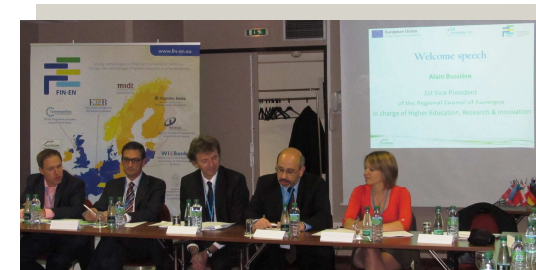
L'Auvergne a accueilli tous ses partenaires pour le 1er groupe de travail thématique « Programmation »

Une proposition de simplification pour la future mise en œuvre des instruments financiers pour la période 2014-2020.