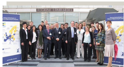
Le partenariat FIN-EN chez le chef de file Finlombarda, à Milan

Réviser les problèmes affectant les PME qui demandent des financements extérieurs.